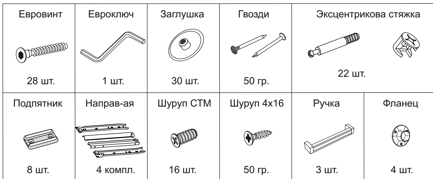
Таблица комплектности фурнитуры