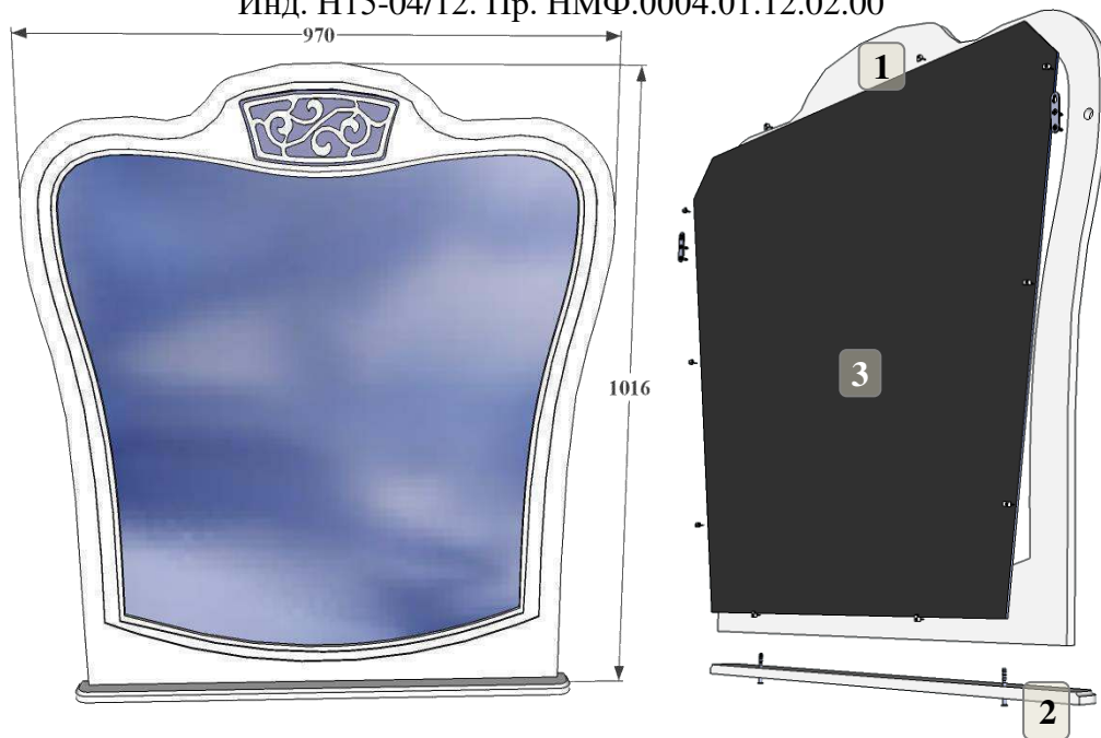
Инструкция по сборке

Инд. Н15-04/12. Пр. НМФ.0004.01.12.02.00