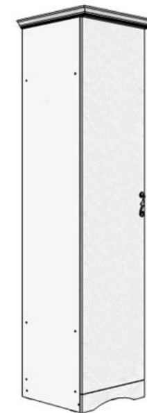
Возможна зеркальная сборка