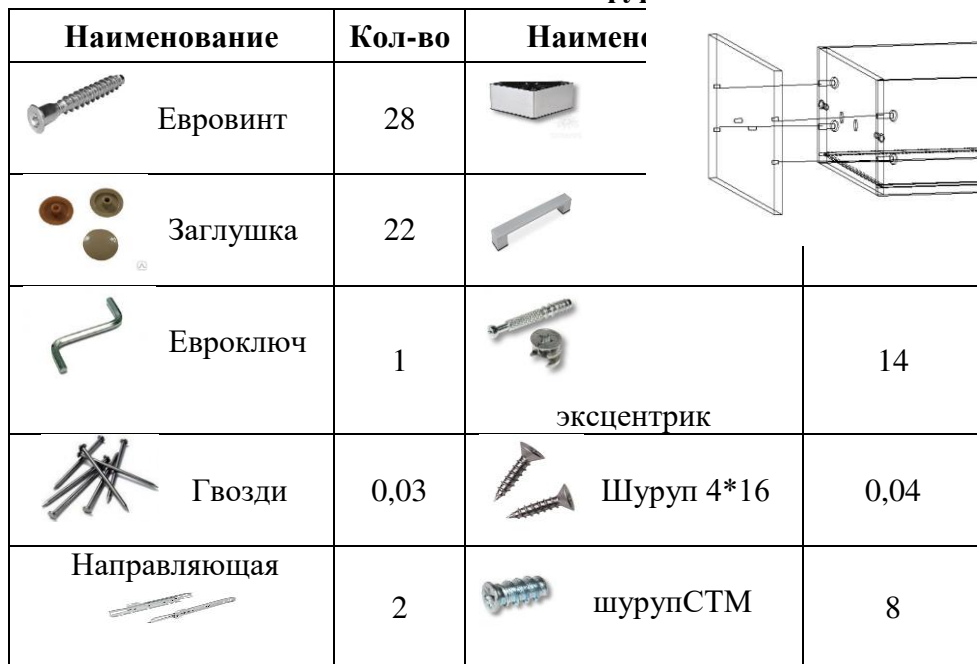
Таблица комплектации фурн